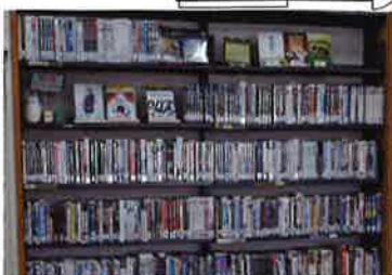
カウンターの後ろにはDVDがズラリ

新着図書のコーナー 毎週新しい本が加わります。話題の本を最初に借りられるかもしれません。