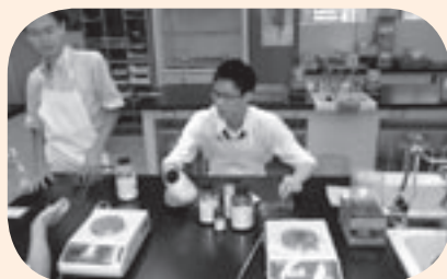
準備ディスカッション